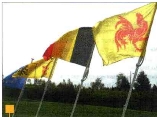
Dans le Hainaut, entre Mons et Nivelles.

E n Belgique, la province de Hainaut regorge de paysages champêtres, riches de forêts et de collines, bordés de chemins de halage invitant aux randonnées le long des nombreux canaux et voies d'eau navigables qui se regroupent au centre de la Belgique, entre Mons et Nivelles. Sillonnée par 264 km de voies d'eau navigables, cette province est traversée par l'historique Canal du Centre ponctué de remarquables ouvrages d'art et, en particulier, des ascenseurs hydrauliques classés en 1981 au titre du Patrimoine mondial par l'UNESCO. A l'époque de leur construction,