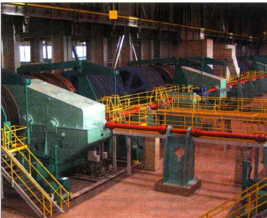
Dans la salle des machines. Les équipements de couleur bleu foncé sont les moteurs de 550 kW.

tion s'arrêterait. Le cahier des charges prévoit toutefois la possibilité de fonctionner avec la boucle mécanique de synchronisation ouverte. Démarrer, freiner le bac, voire même l'arrêter, tout est intégralement géré par les moteurs dont on gère la variation de vitesses dans les 4 quadrants. Dans la salle des machines, apparaissent aussi des freins de manœuvre : ce sont de grands freins à tambour que l'on applique en temps normal, toujours à vitesse nulle. Ces freins ont été dimensionnés pour pouvoir intervenir en arrêt d'urgence, par exemple qu'une coupure de courant survienne lorsque le bac est en mouvement et les freins viendraient immédiatement s'appliquer.