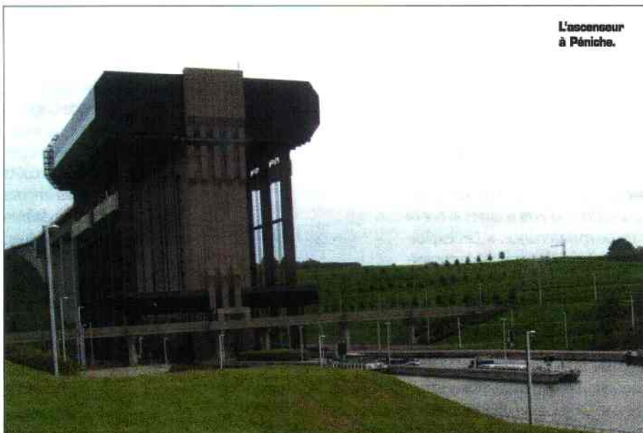
L'ascenseur à Péniche.

La mise en service des voies navigables belges au gabarit de 1 350 tonnes a nécessité la mise en place d'un nouveau tronçon du Canal du Centre et la construction d'un ascenseur à bateaux. On y accède aujourd'hui en empruntant la sortie 21 de l'autoroute E19/E42 et en suivant la flèche « Pays de Génies ». Le Canal du Centre quitte le canal Charleroi-Bruxelles à hauteur de Senefé et rejoint le canal Limy-Blaton-Péronnes en formant un grand bassin que l'on appelle le Grand-Large de Mons. L'amont de l'ascenseur de Strepv s'intègre dans un large bief de 43 km qui rejoint le plan incliné de Ronquières et l'écluse de Viesville. Ce bief, dit de partage, constitue la charnière entre les bassins de la Meuse et de l'Escaut. La porte de garde dite du Blanc-Pain, à la Louvière, doit empêcher la vidange accidentelle du bief : elle se situe à environ 5 km à l'amont de l'ascenseur de Strepv. Pour réunir le canal de Bruxelles provenant d'Anvers et alimenté par la Senne, et la Sambre, du côté de Charleroi, il fallait franchir une dénivellation de 73,15 mètres. Rachetant cette dénivellation, l'as-