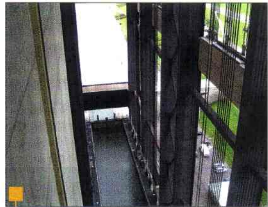
A 73,15 mètres en contrebas : le bac s'apprête à remonter.

Cet ouvrage au caractère exceptionnel est aujourd'hui accessible au public. La visite est truffée de