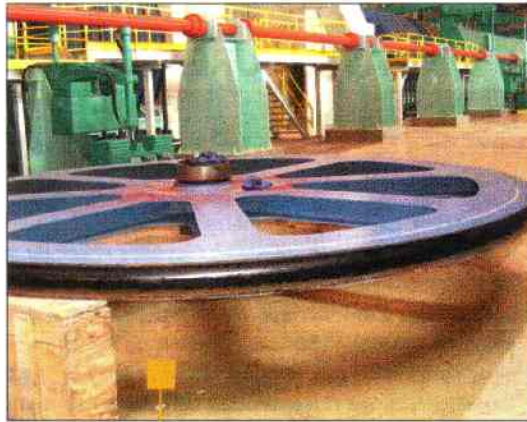
Poulie destinée à être réparée : le cordon de soudure du voile sur le moyeu a cédé.

Quatre moteurs... Une boucle de synchronisation... On ne connaît pas a priori la valeur du couple qui pénètre dans le réducteur de grand diamètre. C'est donc pour limiter le couple reçu, que l'on limite la charge appliquée en dissociant le contrepoids tenu par les 7 poulies libres, du contrepoids tenu par le treuil. La disposition adoptée permet de limiter la charge à la sortie du treuil, et de maîtriser la valeur du couple appliquée sur le réducteur. L'horizontalité de chaque bac est essentielle. Si l'on ne parvenait pas à maîtriser cette horizontalité, l'eau s'accumulerait alors d'un côté avec des conséquences dramatiques. Pour garantir en permanence l'horizontalité du bac, il est fait usage de mesures électroniques : la vitesse de rotation de chacun des moteurs est mesurée en permanence et le moindre écart entraîne l'arrêt du système. La mesure permanente de la vitesse de rotation des tambours permet de s'assurer de la parfaite égalité de ces vitesses. Enfin des mesures